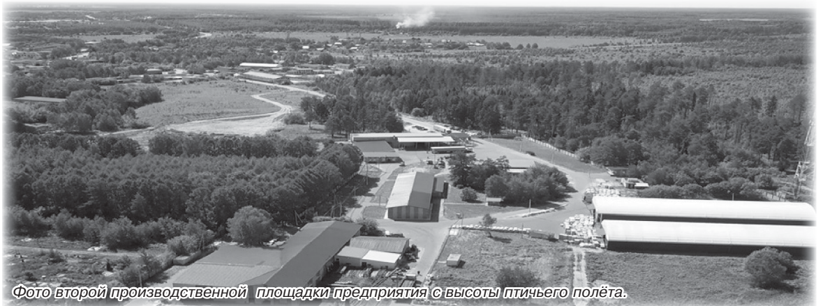
Фото второй производственной площадки предприятия с высоты птичьего полёта.

После тяжелого экономического кризиса и дефолта 1998 года в России начался экономический рост, приведший к резкому увеличению энергопотребления и строительству новых линий электропередачи. Для расширения производственных мощностей руководство «Московского завода высоковольтной арматуры» принимает решение о создании в г. Чкаловске самостоятельного территориально обособленного производственного подразделения.