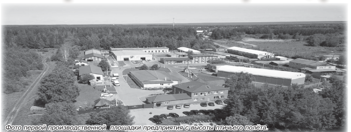
Фото первой производственной площадки предприятия с высоты птичьего полёта.