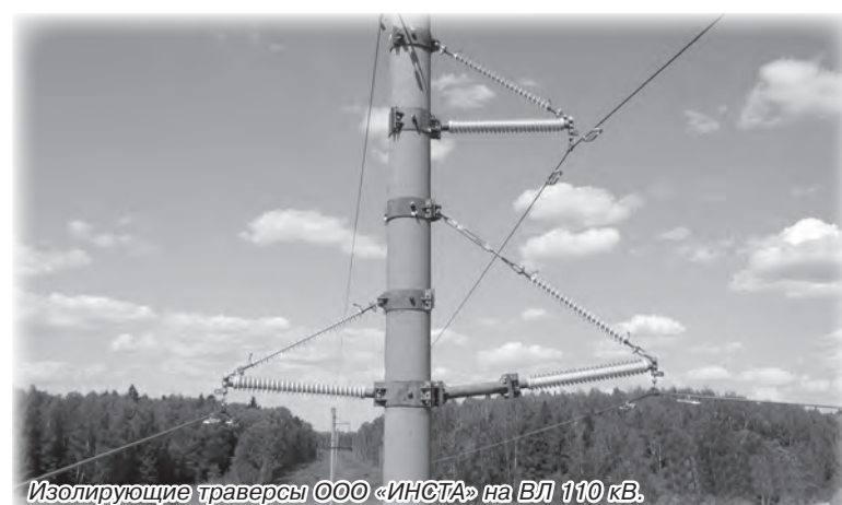
Изолирующие траверсы ООО «ИНСТА» на ВЛ 110 кВ.

В 2000 году в Нижнем Новгороде создается компания по выпуску полимерных изоляторов – ООО «Нижнов