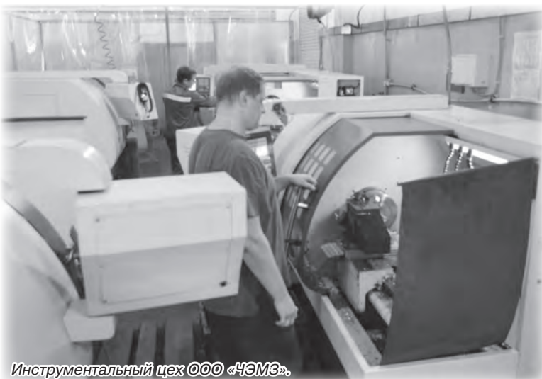
Инструментальный цех ООО «ЧЭМЗ».

вся продукция производится на высокопроизводительных литьевых инжекционных машинах по технологии изготовления полимерных изоляторов третьего поколения. За пятнадцать лет произведено и отгружено потребителям более четырех миллионов изоляторов на различные классы напряжения и механических нагрузок. Многие изделия были освоены в серийном производстве впервые в России.