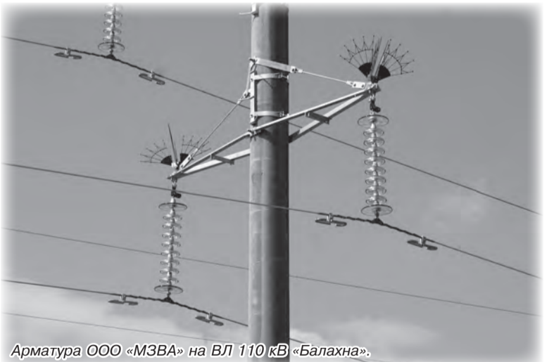
Арматура ООО «МЗВА» на ВЛ 110 кВ «Балахна».

Спустя двадцать лет можно ответственно утверждать, что ООО «МЗВА» – это динамично растущая, высокоэффективная, социально-ориентированная, ведущая отечественная компания по производству линейной арматуры для ВЛ и подстанций. Отлаженная организация работы на всех этапах производства, ответственность сотрудников, высокое качество изделий позволяют с гордостью указывать на продукции: «Изготовитель – «МЗВА».