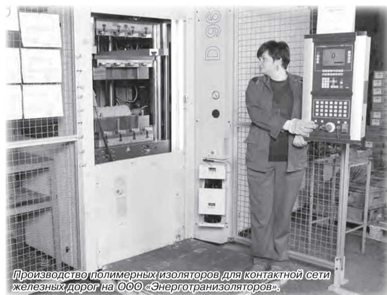
Производство полимерных изоляторов для контактной сети железных дорог на ООО «Энерготрансизолятор».