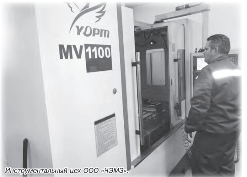
Инструментальный цех ООО «ЧЭМЗ».

структура управления, применяются современные информационные продукты, разрабатываются критерии оценки качества товара. Предприятие готово предложить интересную работу и достойную заработную плату тем, кто имеет соответствующий опыт или интерес к современной технике. Постоянное освоение новых изделий в серийном производстве, проведение сложных испытаний в собственном испытательном центре, проектирование и изготовление необходимой оснастки и инструмента в инструментальном цехе завода – это короткий перечень задач,