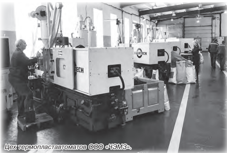
Цех термопластавтоматов ООО «ЧЭМЗ».

Инициаторы инновационного проекта создания современного производства полимерных изоляторов изначально ставили перед собой амбициозные задачи: на новом предприятии необходимо было организовать серийный выпуск таких изоляторов, которые стали бы лучшими на рынке, превосходили бы по техническим характеристикам существовавшие в то время аналоги, гарантируя эксплуатирующим организациям новый уровень надежности. В